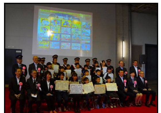
平成 28 年度 表彰式写真